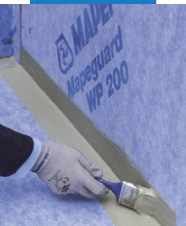
Aplikácia Mapeguard WP Adhesive v styku stény a podlahy pre účel vytesnenia tohto miesta, pred lepením pásy Mapeguard ST