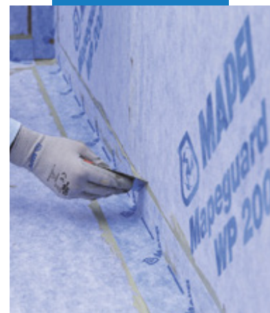
Aplikácia Mapeguard ST

Príslušné odkazy na produkt sú k dispozícii na vyžiadanie alebo na www.mapei.sk a www.mapei.com