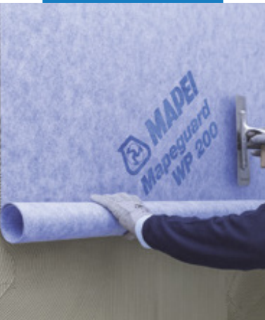
Lepenie membrány Mapeguard WP 200