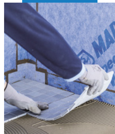
Lepenie obkladových prvkov